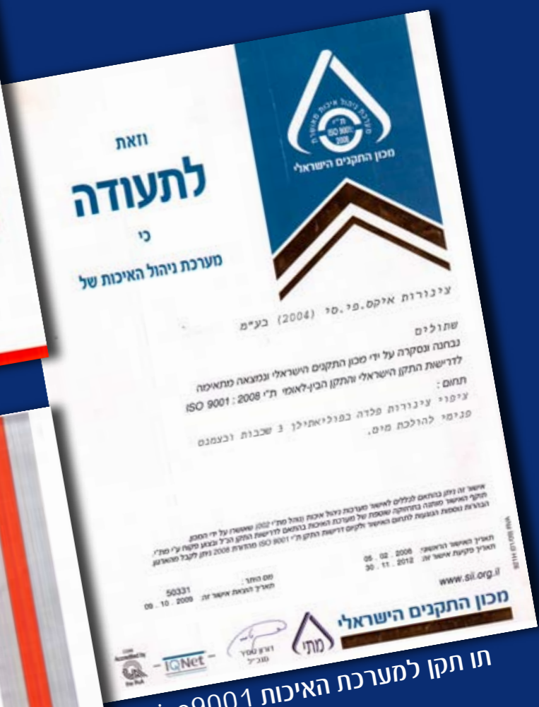
תו תקן למערכת האיכות של iso9001

צינורות איקס פי.סי (2004) בע"מ כפר מנחם, ת.ד. 223 גן-יבנה, טל': 08-8662645, פקס: 08-8655772