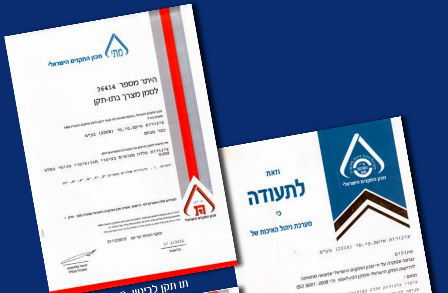
תו תקן לביטון פנימי