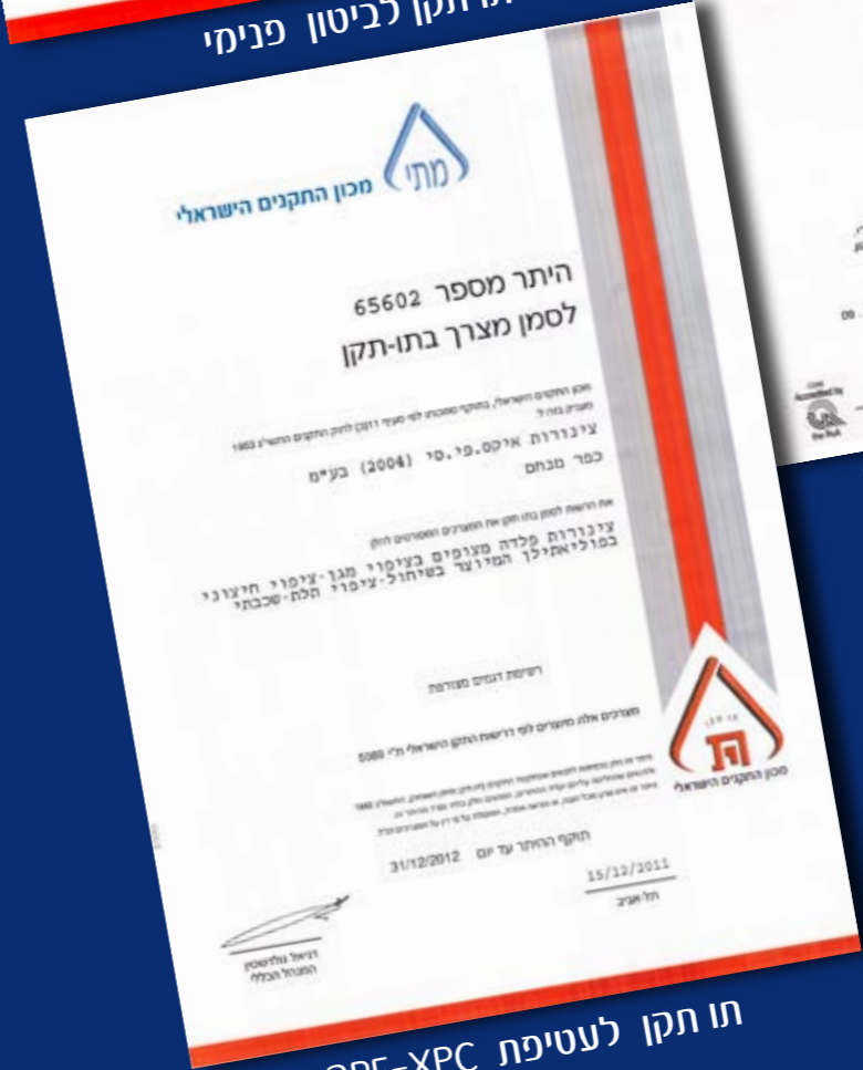
תו תקן לעטיפת 3PE-XPC